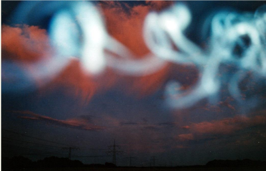
Irrlichter (10/2011, analoge Fotografie)